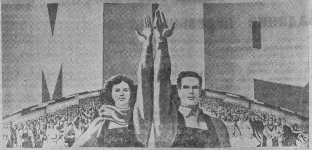
Плакат художника Д. Филатова. Издательство «Плакат».