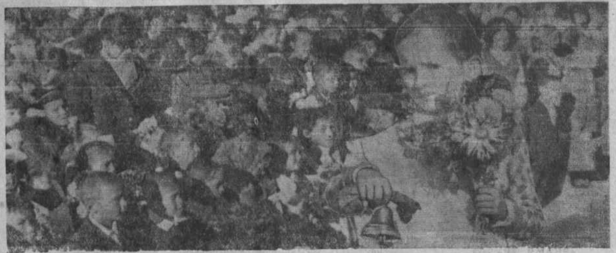
НА СНИМКЕ: первый звонок в Акъярской средней школе № 1.