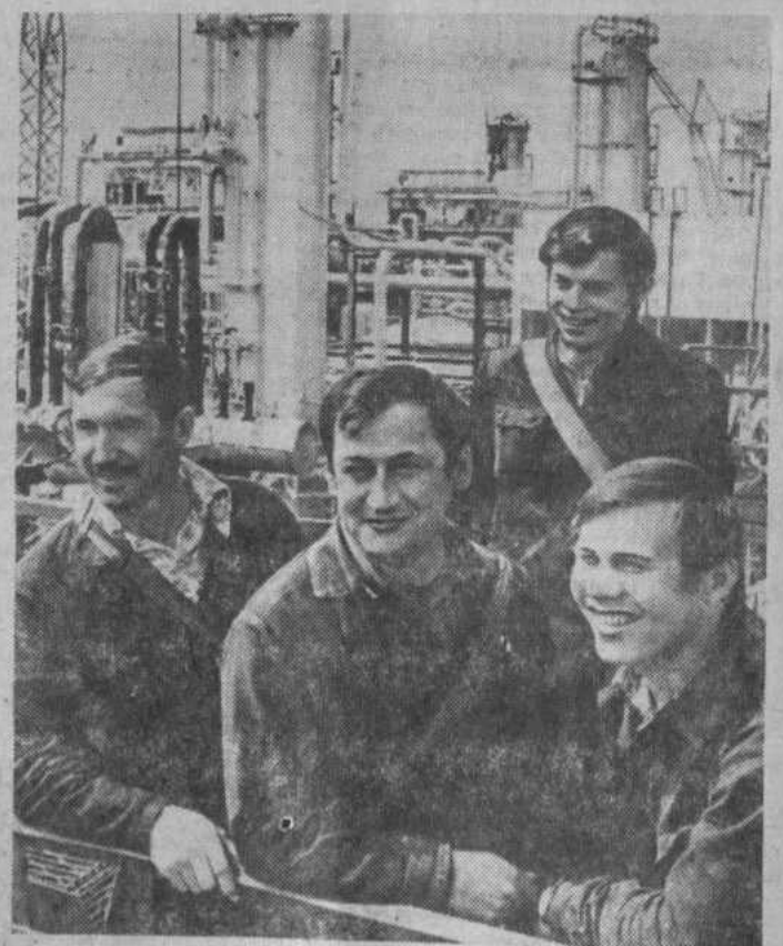
Коллектив Оренбургского газоперерабатывающего завода с начала года дал сверх плана сотни миллионов кубометров газа.

Завод является начальным звеном в формировании крупного промышленного комплекса по добыче и переработке газа на базе Оренбургского газоконденсатного месторождения.