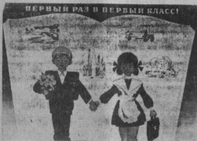
ПЕРВЫЙ РАЗ В ПЕРВЫЙ КЛАСС!