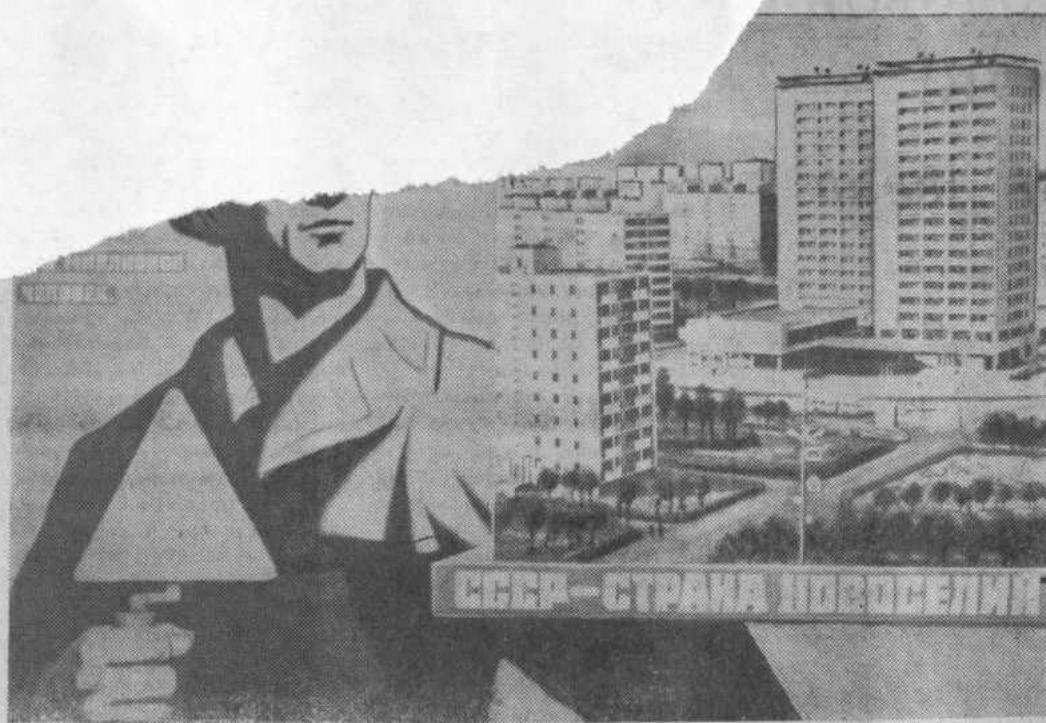
Плакат художника Л. Голованова к Дню строителя. Издательство «Плакат».