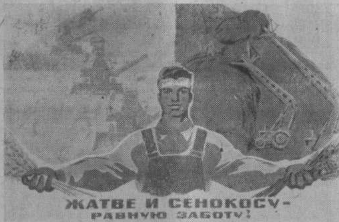
ЖАТВЕ И СЕНОКОСУ - РАВНУЮ ЗАБОТУ!

Плакат художника Б. Решетникова. Издательство «Плакат».