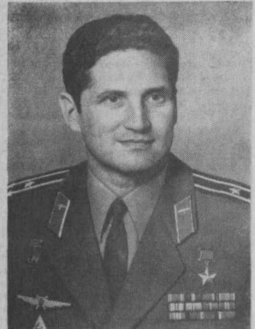
Командир экипажа космического корабля «Союз-21» летчик-космонавт СССР, Герой Советского Союза, полковник Борис Валентинович Вольнов.