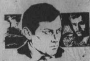
БРИЛЛИАНТЫ ДЛЯ ДИКТАТУРЫ ПРОЛЕТАРИАТА

Кинофильм «Бриллианты для диктатуры пролетариата» состоит из двух серий. Фильм поставлен режиссером-постановщиком Г. Кромановым.