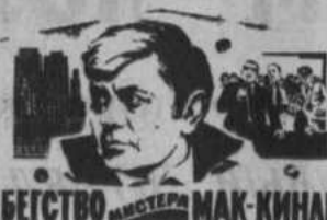
БЕГСТВО МИСТЕРА МАК-КИНИ

В ближайшие дни Башкинское отделение Башкинпроката выпускает на экраны новые художественные кинофильмы.