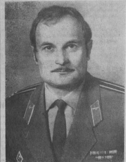
Бортинженер космического корабля «Союз-21» подполковник Виталий Михайлович Жолобов.