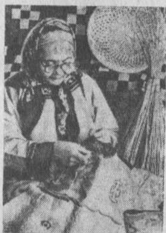
Фото и текст Ф. ГАЙ-НЕТДИНОВОЙ.

ХАБАРОВСКИЙ КРАЙ. Славится народными промыслами ульское село Булава. Торбаза, таночки, залаты, корзины из ивовых прутьев, выполненные умельцами, пользуются большим спросом, успешно экспонировались на выставках.