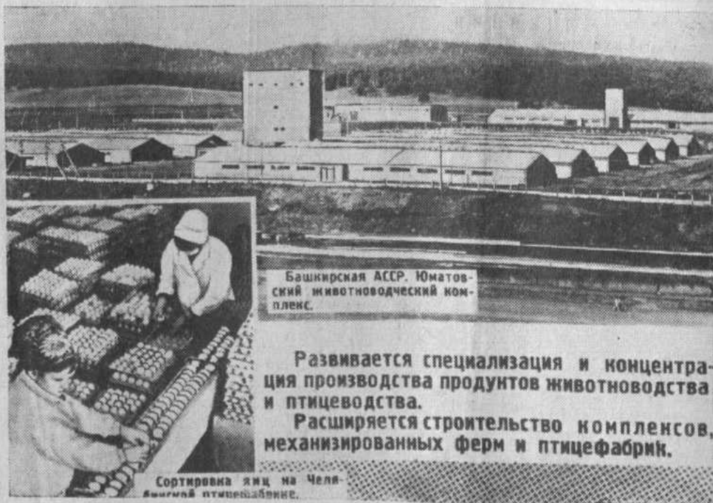
Башкирская АССР. Юматовский животноводческий комплекс.

Развивается специализация и концентрация производства продуктов животноводства и птицеводства. Расширяется строительство комплексов, механизированных ферм и птицефабрик.