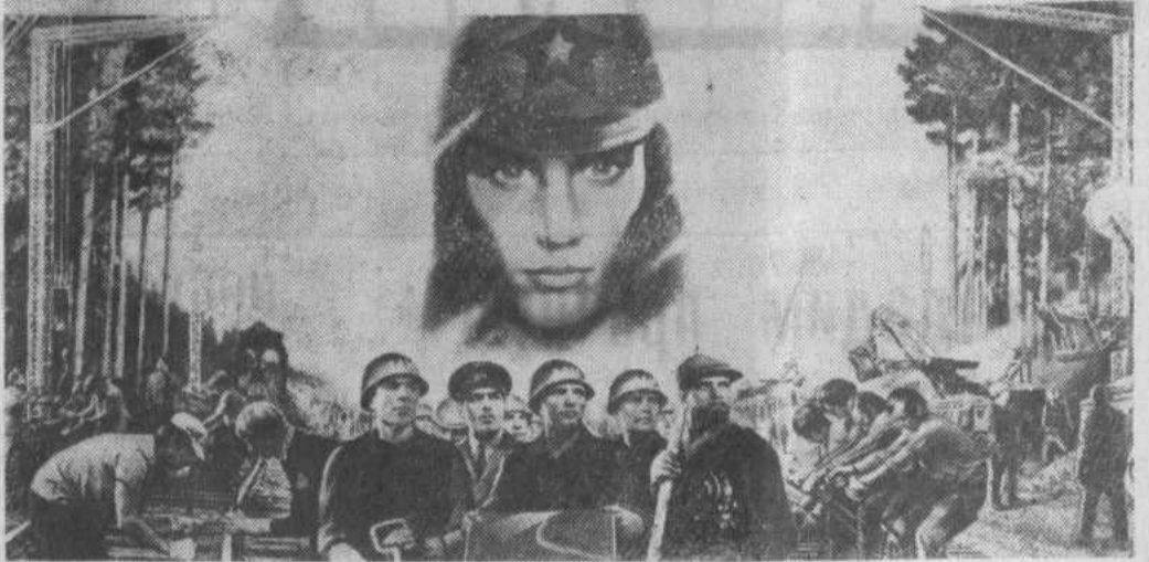
Плакат художника В. Корещкого к Дню советской молодежи. Издательство «Плакат», (Фотохроника ТАСС).

НАШ ТРУД И НАШИ СЕРДЦА — ТЕБЕ, РОДНАЯ ПАРТИЯ!