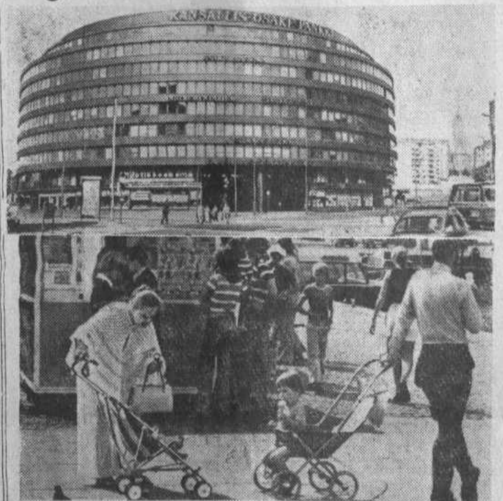
Хельсинки — столица Финляндии, крупный индустриальный и торговый центр страны. НА СНИМКАХ: в центре города; воскресная прогулка.