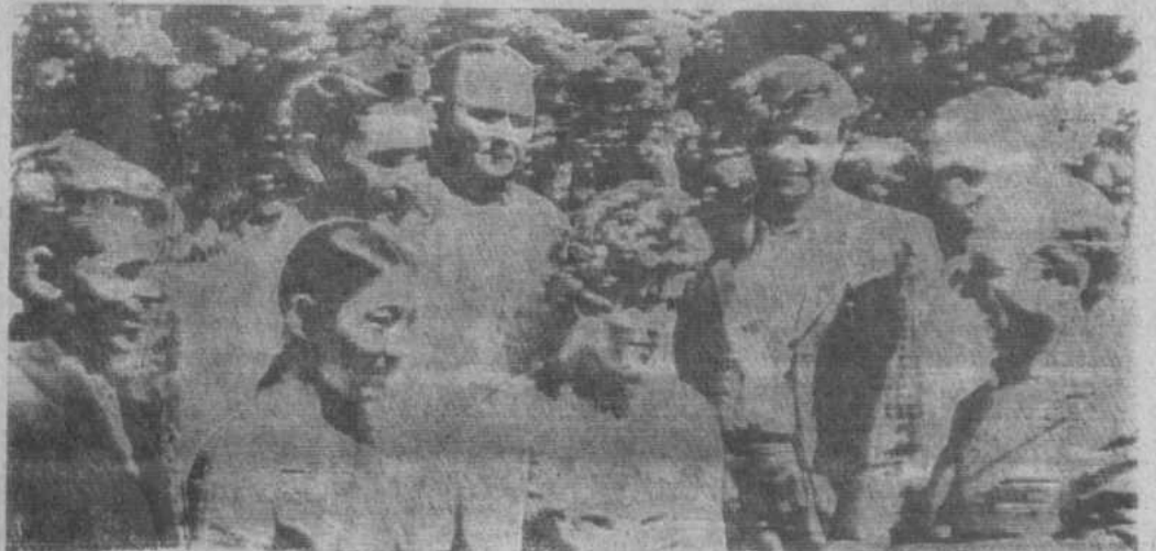
НА СНИМКЕ: группа участников собрания.