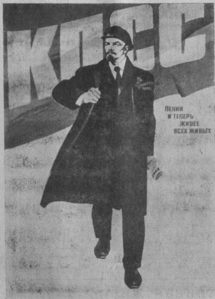
Плакат художника В. Сачкова. Издательство «Плакат».