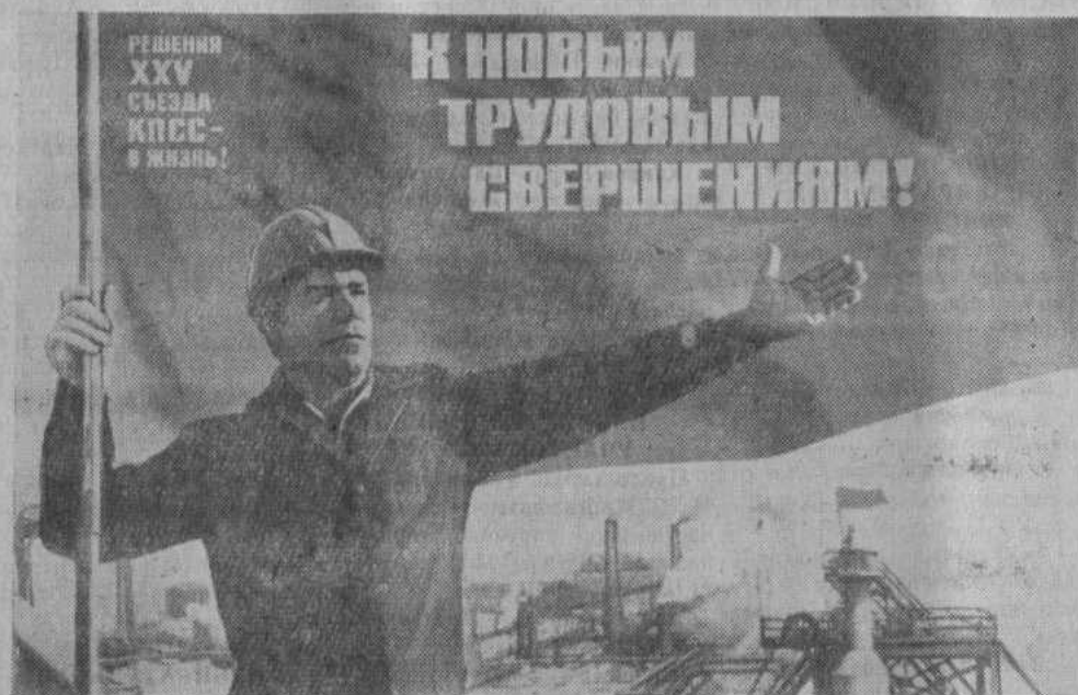
Плакат художника Б. Березовского. Издательство «Плакат».