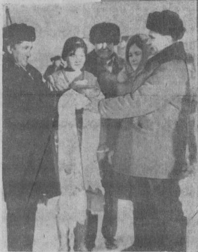
У арки Хайбуллинского совхоза хозяева встречают хлебом-солью делегацию соседнего Таналякского совхоза.