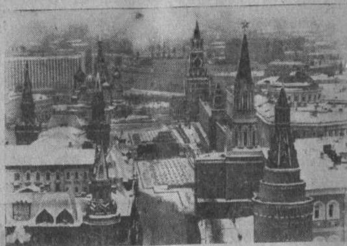
Москва. Вид на Кремль и Красную площадь.