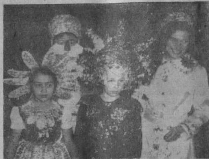
На новогоднем празднике в Ивановской средней школе.