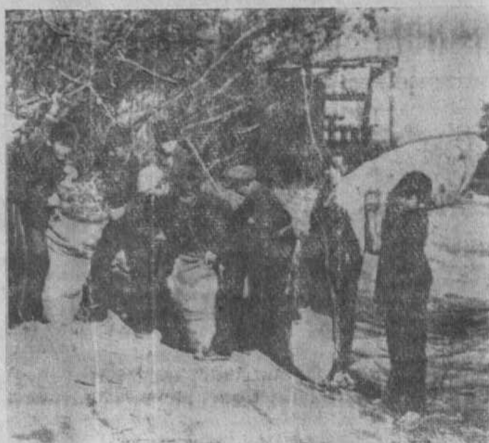
Большую помощь оказывают учащиеся Акъярской средней школы в заготовке веточного корма.