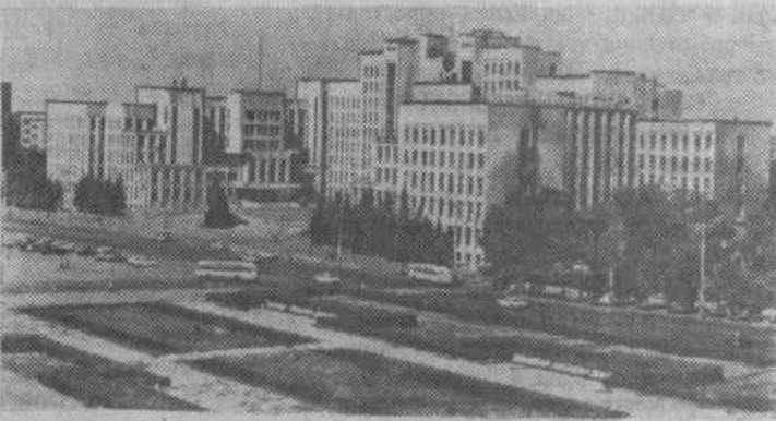
МИНСК. Площадь имени В. И. Ленина.