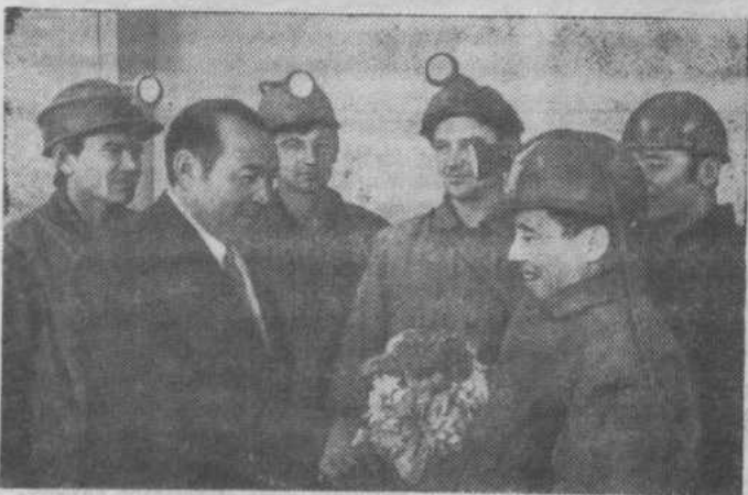
КАЗАХСКАЯ ССР. На шахте № 55 Западного рудника Дзержинского «ЗНАМЯ ТРУДА», 28 декабря 1974 года, 2 стр.

органа Ленина горно-металлургического комбината пройдена наклонная штольня. Почти полуторакилометровая подземная