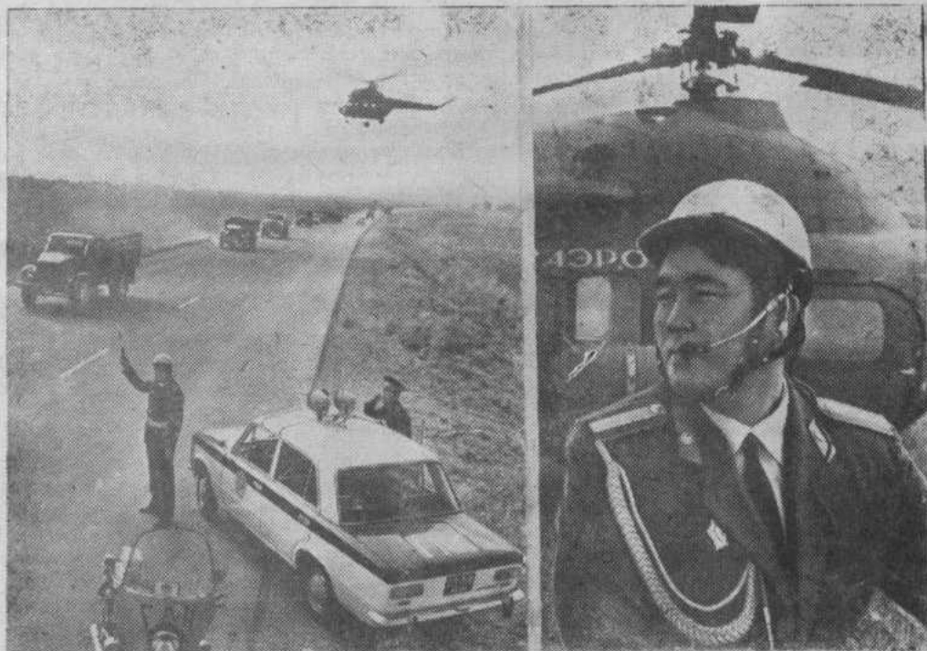
На левом снимке: вертолет ГАИ на трассе.