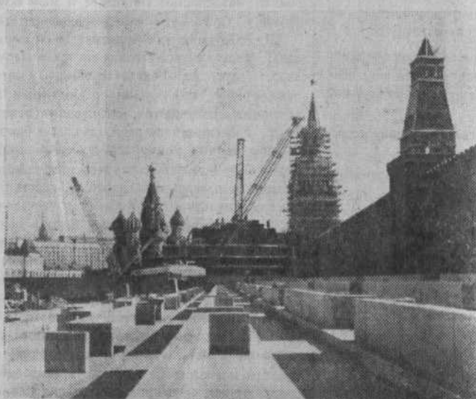
Древняя и вечно юная Красная площадь Москвы—главная площадь нашей великой страны.