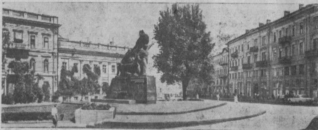
Одесса сегодня. Площадь Потемкинцев.