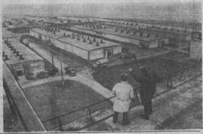
Оренбургская область. Орская птицеводческая фабрика—лучшее промышленное предприятие области по производству яиц и диетического мяса. В просторных механизированных цехах клеточного содержания находится 250 тысяч несушек. Раздача кормов, сбор яиц, уборка помещений проводятся с помощью машин. Сейчас вводятся автоматизированные устройства, в которых запрограммированы все процессы ухода за пернатым населением птицеграда. За семь месяцев фабрика дала 36 миллионов яиц—на 10 миллионов больше задания. Себестоимость тысячи яиц снижена на 5 рублей 50 копеек.