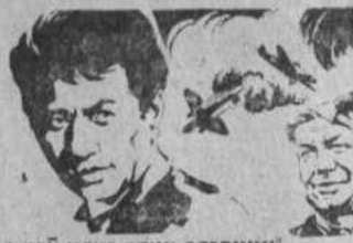
В бой идут одни «старики»

На экране кинотеатра с Акъяр зрители в сентябре смогут посмотреть новые художественные фильмы. Один из них «В бой идут одни «старики». Герои фильма — юные летчики, со школьной скамьи шагавшие в суровые будни жесточайшей из войн. И они выдержали испытание, до конца выполнили свой долг, показав всему миру величие новой исторической общности людей, имя которой — советский народ.