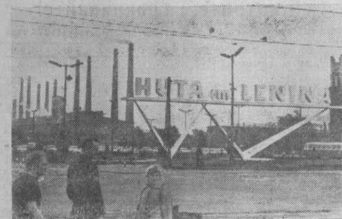
Польская Народная Республика, металлургический комбинат имени В. И. Ленина в Новой Гуте, построенный с братской помощью Советского Союза.