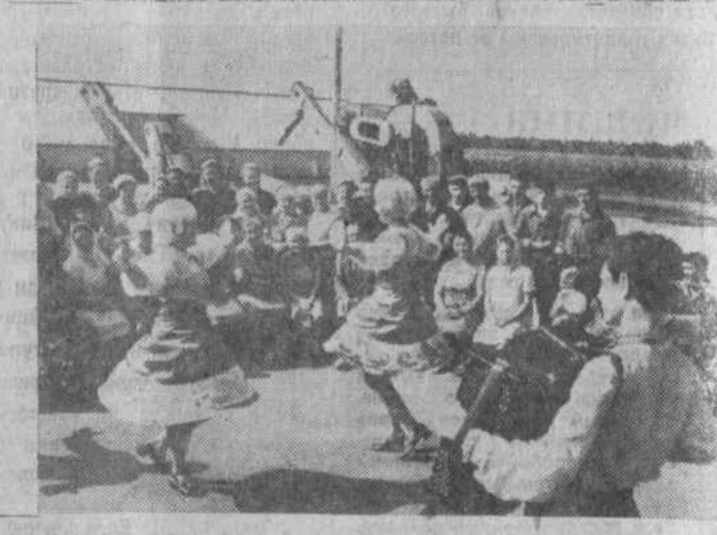
На нижнем снимке: концерт в пятой бригаде.