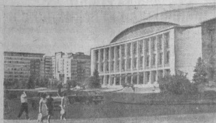
Социалистическая Республика Румыния Дворец республики в Бухаресте.

23 АВГУСТА ИСПОЛНЯЕТСЯ 30 ЛЕТ СО ДНЯ ОСВОБОЖДЕНИЯ РУМЫНИИ ОТ ФАШИСТСКОГО ИГА.