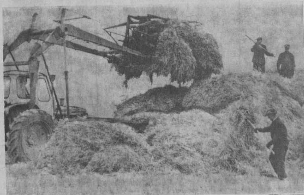
НА СНИМКЕ: скирдование сена.