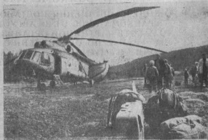
Совсем недавно в сибирской тайге появились первые палатки строителей Байкало-Амурской железнодорожной магистрали. А сейчас в поселки первопроходцев регулярно, несколько раз в сутки, авиаторы доставляют людей, строительные материалы, топливо, продукты.

Тайга понемногу отступает. Строятся общежития, школы, клубы. Ведь молодежь устраивается в этих краях не на один год. Протяженность будущей трассы свыше 3.000 километров — от станции Лена Восточно-Сибирской железной дороги до Комсомольска-на-Амуре. Магистраль имеет огромное значение в освоении природных богатств края.