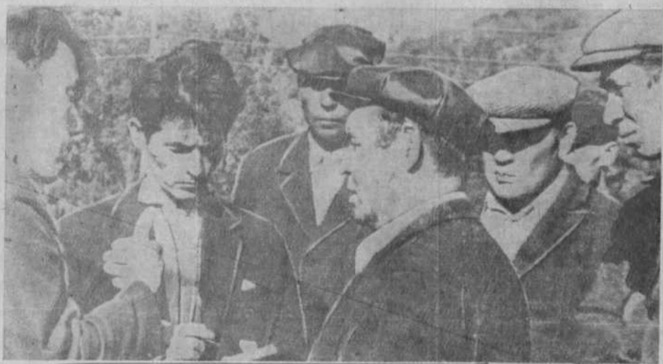
НА СНИМКЕ: участники семинара берут интервью у заведующего карова.