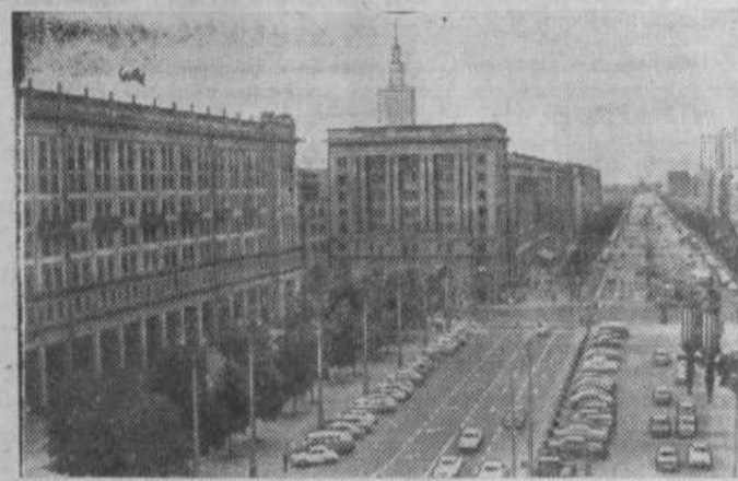
Маршалковская — одна из центральных магистралей Варшавы. Эта прямая, просторная, всегда оживленная улица протянулась на несколько километров.