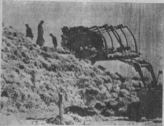
НА СНИМКЕ: укладка прессованного сена. Акъярский совхоз.