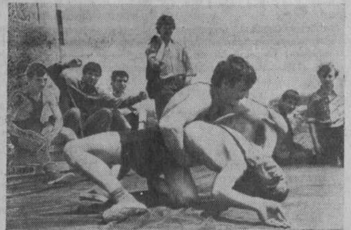
В большом почете спорт в колхозе имени Ленина Бершадского района Винницкой области. Общество «Колос» объединяет более 400 человек, которые занимаются в секциях тяжелой атлетики, волейбола, баскетбола, шахматно-шашечной, настольного тенниса.