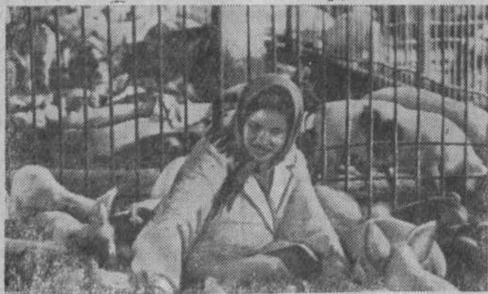
Марийская АССР. Свиноводческий комплекс совхоза «Алексеевский» создан недавно. Он рассчитан на производство 300 тонн свинины в год. Сооружение комплекса обошлось хозяйству в 1220 тысяч рублей. По подсчетам специалистов, затраты окупятся через четыре года.

В этом году предстоит убрать зерновые культуры с площади 108 326 га. Большой объем работы требует хорошей организованности. Особое внимание следует уделить регулировке комбайнов, герметизации, оборудованию копнителей, косовице и спаренные валки. Уже сейчас необходимо составить рабочие планы, продумать маршруты движения агрегатов, систему обслуживания машин, их заправку горючим, предусмотреть четкую расстановку сил и средств по бригадам и отделениям. Важно разработать условия социалистического соревнования, меры морального и материального поощрения.