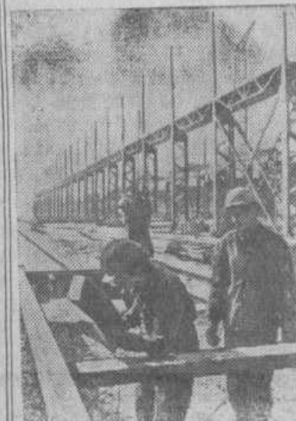
ПНР. Быстрыми темпами возводится в Катовицком воеводстве один из самых крупных объектов черной металлургии — комбинат «Катовице» (на снимке). В его сооружение вносят значительный вклад советские специалисты.