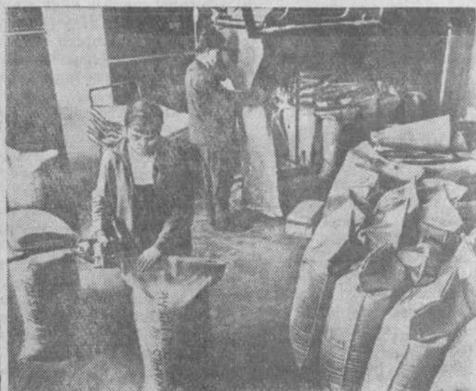
Социалистическая Чехословакия является крупнейшим производителем и экспортером солода применяемого при производстве спирта, грожжей, пива, кваса. Тридцать шесть стран, включая Советский Союз, покупают этот высококачественный продукт. НА СНИМКЕ: подготовка к отправке солода, изготовленного на заводе в городе Литовель.