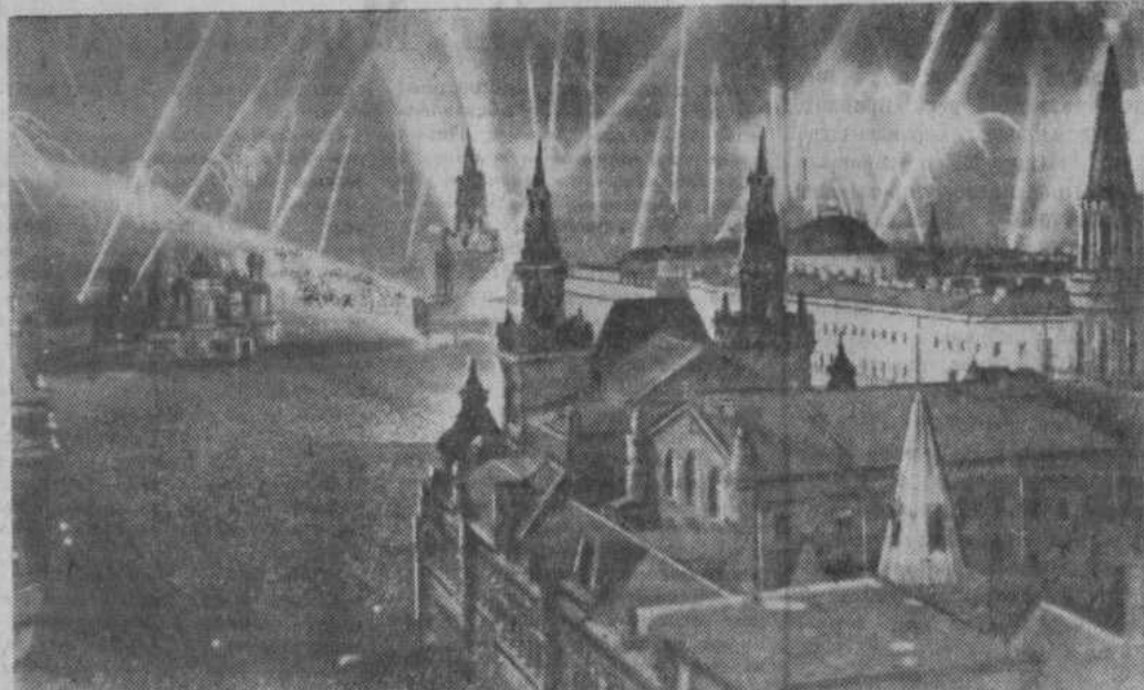
День Победы 9 мая 1945 нашей Родины Москва салютует Военно-Морского Флота. года. 22 часа. В ознаменование полной победы над Германией столица доблестным войскам Красной Армии, кораблям и частям.

Ф. КУСЯКОВ, секретарь комитета ВЛКСМ Маканского совхоза.