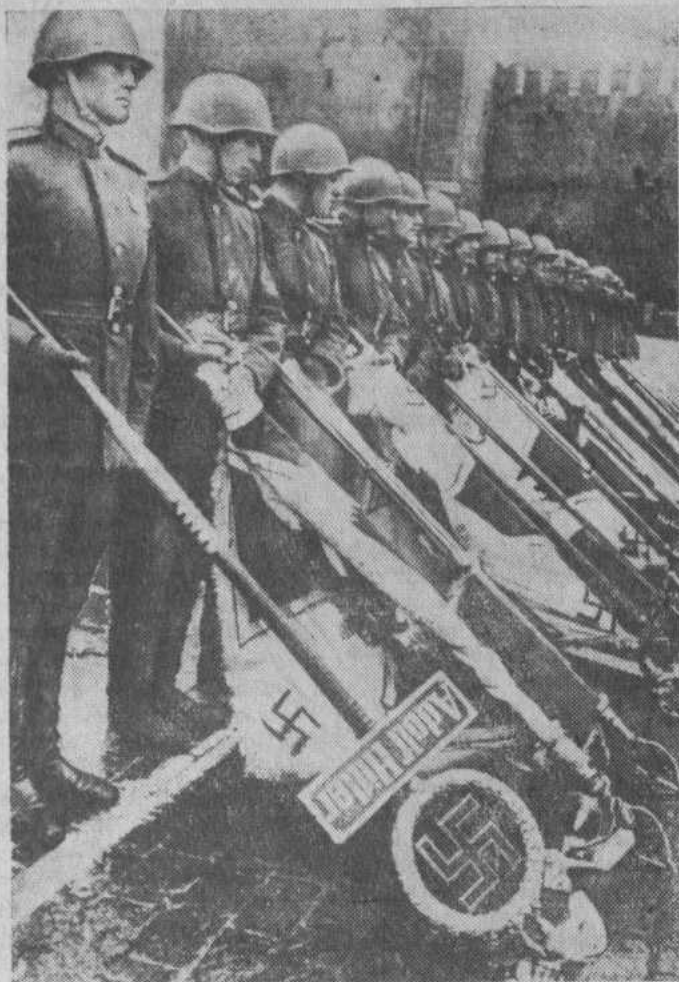
Москва. Парад Победы. Эти гитлеровские знамена будут брошены к подножию Мавзолея.