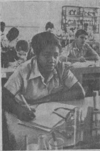
В. И. Ленина. Он включает в себя более 20 современных учебных зданий.

лаборатории, общежития, помещения для отдыха и занятия спортом. Здесь созданы все условия для учебы: лингафонные кабинеты, физические и биологические лаборатории, полученные в дар от Советского Союза, удобные классные комнаты, производственные мастерские. Сейчас в школе около 4,5 тысяч учащихся. Они сочетают учебу с общественно полезным трудом.