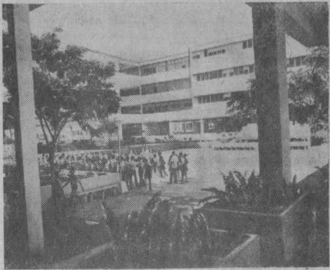
В пригороде кубинской столицы открыт большой учебный комплекс, которому присвоено имя