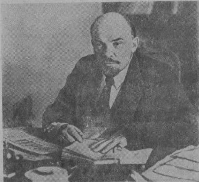
В. И. Ленин в своем кабинете в Кремле, Москва, октябрь 1918 года.

он не умер, Он доньше в каждом дне работ, Он доньше в каждой нашей думе, В каждом нашем подвиге живет,