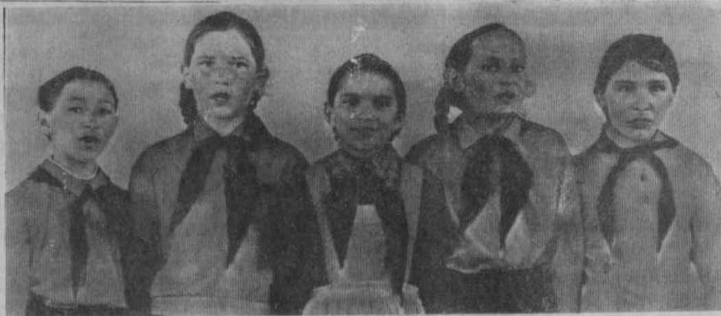
Торжественно отметили учащиеся Султангузинской восьмилетней школы День космонавтики. В этот день был проведен пионерский сбор. Собравшиеся прослушали передачу из Москвы, посвященную Дню космонавтики. Затем был показан музыкальный монтаж. Особенно понравил-

ась песня «Путешественник» в исполнении учащихся четвертого класса.