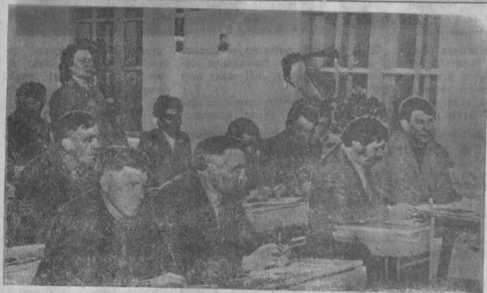
На снимке нашего фотокорреспондента В. Усмана вы видите слушателей школы основ марксизма-ленинизма

пропагандист партийной организации Бурибаевского рудоуправления.