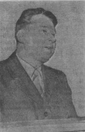
В. И. КАРПАЕВ — председатель исполкома Гайского райсовета Оренбургской области.

Коллектив нашего предприятия успешно справился с выполнением плановых заданий прошлого года. Для мобилизации коллектива на выполнение установленных заданий широко развернуто соревнование между бригадами и отдельными рабочими, разработаны меры морального и материального поощрения. Хороших показателей добилась бригада автомашинистов КАЗ-608, в которой я работаю. При плане 30000 мы перевезли 36700 тонн грузов, сделали 3494549 тонна-километров или больше против плана на 644648 тонна-километров. Я лично выработал 290 тысяч тонна-километров при обязательстве 250 тысяч, и обязуюсь в этом году сделать 300 тысяч тонна-километров.