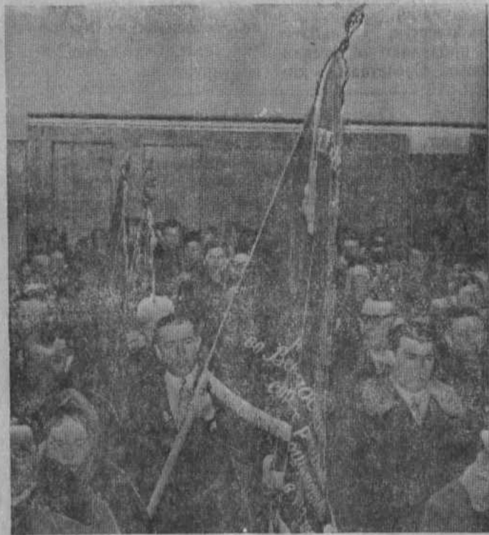
На снимке: внос Красного знамени ЦК КПСС, Совета Министров СССР, ВЦСПС и ЦК ВЛКСМ.

Отмечена хорошая работа по производству и продаже государству продуктов животноводства, повышению продуктивности, росту поголовья скота ордена Ленина Матраевского совхоза, колхозов имени Ленина, им. Салавата.