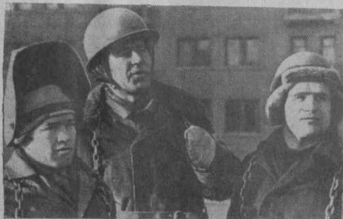
Москва. Коллектив 2-го монтажного управления треста «Стальмонтаж» ус-