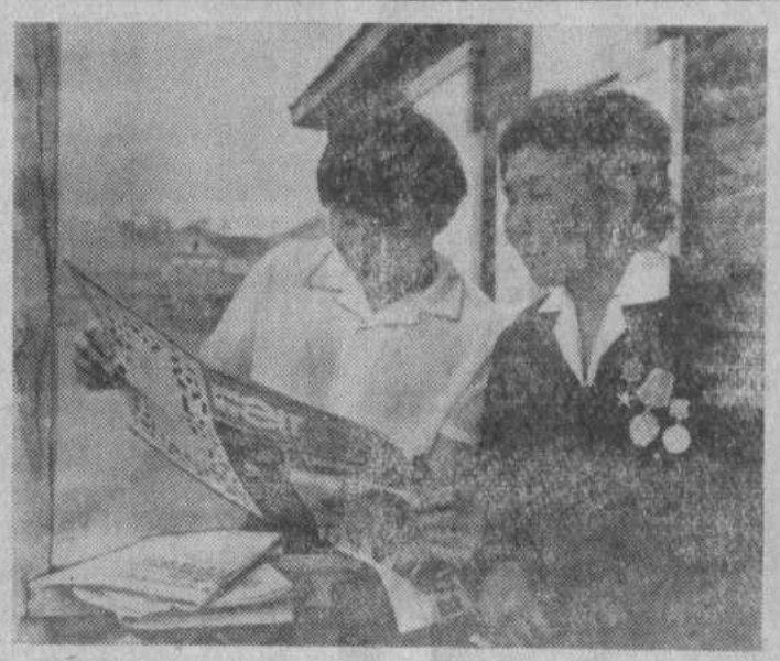
Бурятская АССР. Колхоз имени Карла Маркса Селенгинского района занимает почти 60 тысяч гектаров земель, на которых до Советской власти кочевали с байскими отарами бедняки-буряты.

А. Сыроваткин, корреспондент ТАСС. Саратов.