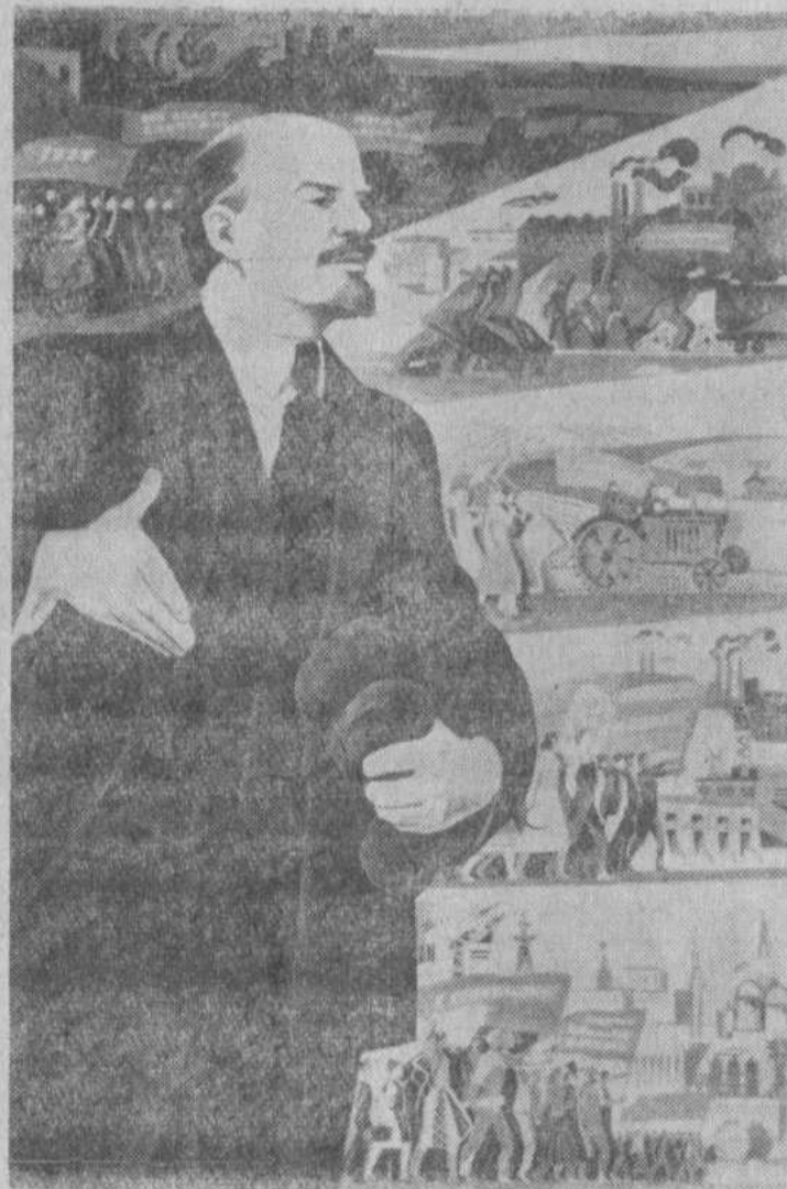
Плакат художника Э. Арцруняна (издательство «Изобразительное искусство»).