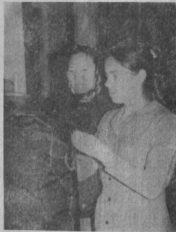
На снимке: А. Г. Волкова.

Л. Борзова, заведующая Бурибаевским домом быта.