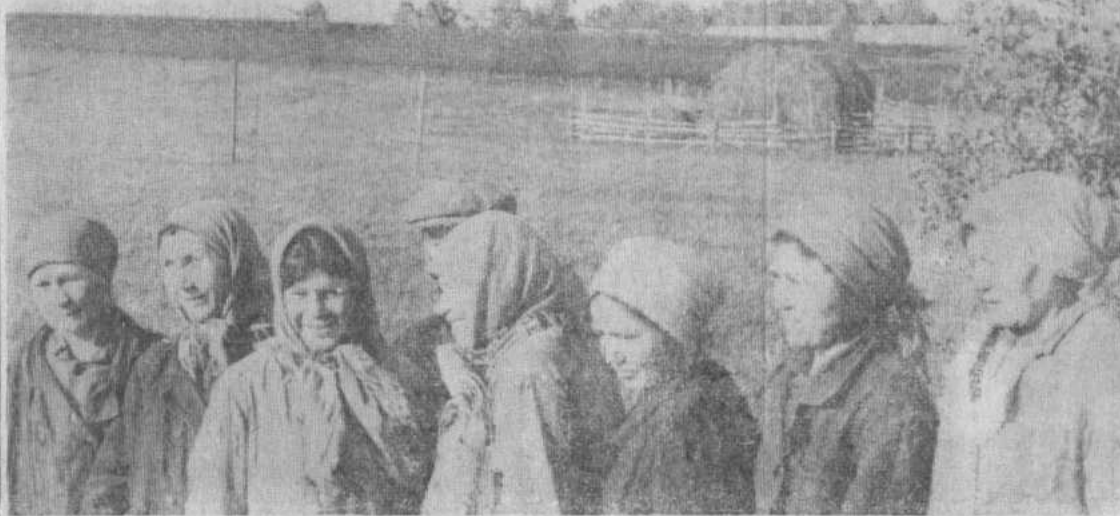
На этом снимке вы видите группу доярок Пугачевской фермы. Они победители социалистического соревнования в колхозе им. Ленина. В августе коллектив фермы, надаив от каждой коровы по 280 килограммов молока, занял первое место среди ферм колхоза.