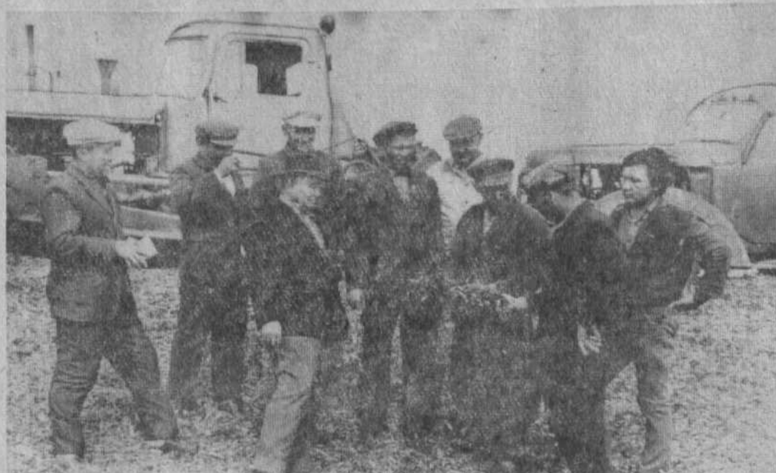
Соревнование колхозов им. Фрунзе и им. Калинина стало традицией. Наш фотокорреспондент В. Усманов запечатлел представителей хозяйств во время взаимной проверки хода социалистического соревнования в колхозе им. Фрунзе.

ОНИ ЗАНЕСЕНЫ НА РЕСПУБЛИКАНСКУЮ ДОСКУ ПОЧЕТА