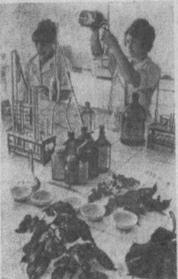
КУЙБЫШЕВСКАЯ ОБЛАСТЬ. Совхоз «Овощевод» круглый год снабжает свежими овощами город Тольятти. Это первый в области экспериментальный совхоз, выращивающий овощи на гидропонике.

В этом году государству уже продано более 850 тонн овощей. Коллектив близок к выполнению годового плана. В совхозе организована агрохимическая лаборатория, которая ежедневно проводит анализ питательного раствора непосредственно из почвы, определяет освещенность теплиц и проводит коррекцию теплового режима.