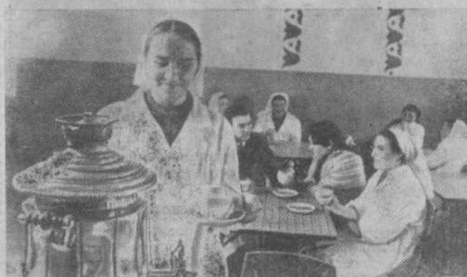
Татарская АССР. В колхозе имени Вахитова Пестречинского района открыт Дом животноводов. Он

построен на средства, заработанные колхозниками на коммунистических субботниках. В здании есть лекционный зал, молочная лаборатория, комната для специалистов, буфет, комната отдыха, душевые. В Доме животноводов можно купить продукты для дома, обменять библиотечную книгу.