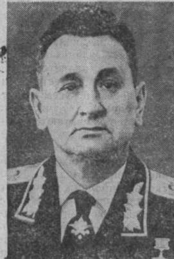
Член Политбюро ЦК КПСС тов. А. А. ГРЕЧКО