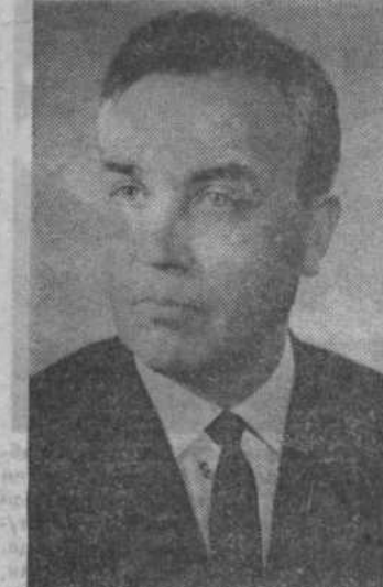
Кандидат в члены Политбюро ЦК КПСС тов. Г. В. РОМАНОВ