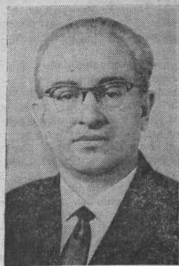
Член Политбюро ЦК КПСС тов. Ю. В. АНДРОПОВ