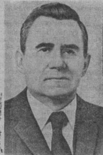
Член Политбюро ЦК КПСС тов. А. А. ГРОМЫКО