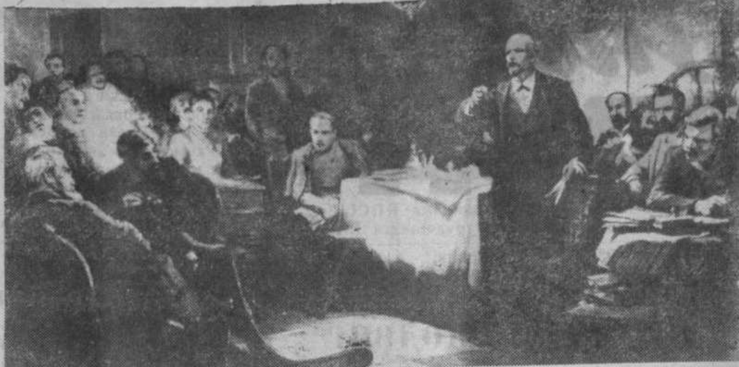
«В. И. Ленин выступает на II съезде РСДРП».