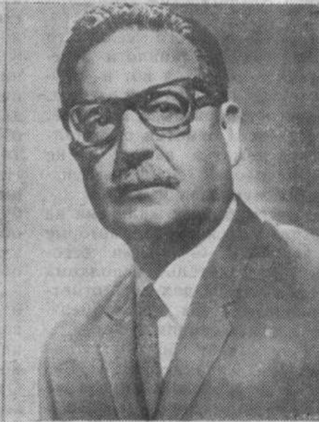
Сальвадор Альенде Госсенс