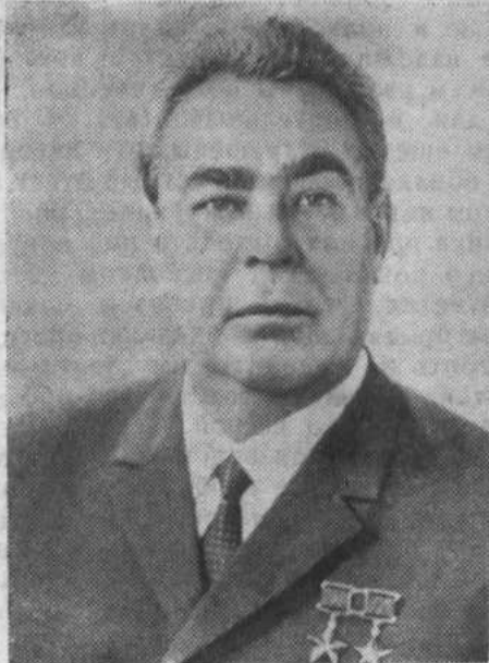
Леонид Ильич Брежнев

Хуан Маринельо (Куба) Пабло Неруда (Чили) Томский Н. В. (СССР) Георгий Трайков (Болгария) Каору Ясун (Япония)