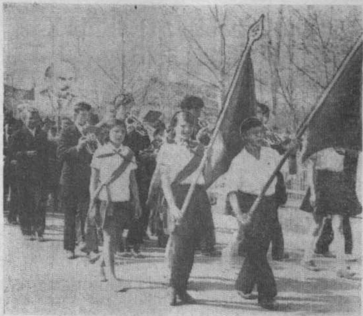
НА СНИМКЕ: Первомайская демонстрация в райцентре.