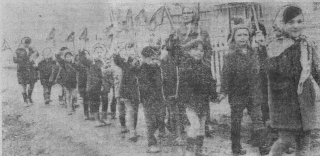
Чествование коммунистами детского сада-яслей ПМК-292.