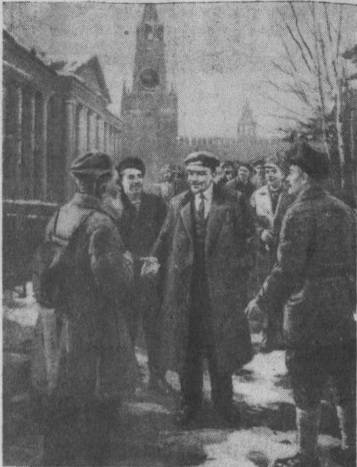
«Ходоки у В. И. Ленина». Картина художника Д. Налбаджяна. 1967 год. (С выставки Центрального музея имени В. И. Ленина).

22 АПРЕЛЯ—103-я ГОДОВЩИНА СО ДНЯ РОЖДЕНИЯ В. И. ЛЕНИНА