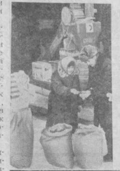
«ЗНАМЯ ТРУДА», 17 апреля 1973 г., 3 стр.