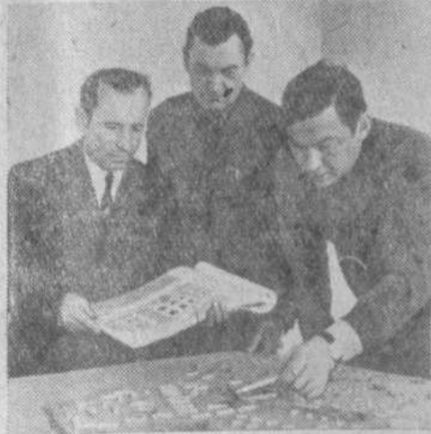
бытовые нужды один миллион семьсот тысяч рублей.

В нынешнем году колхоз выделил на общественное строительство и культурно-